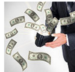
השתמשו בכספים - ויחזירו אותם

לטענת קבוצת החרדים, הכספים הועברו לעורך דין שהפקיד אותם בחשבון נאמנות מיוחד של פורום האדריכלים - שהוא בעל מניות בה. ואולם, לאחר שהפרויקט לא יצא לפועל בסופו של דבר, לא קיבלו חברי הקבוצה את הכספים בחזרה ואף גילו כי הפורום, עורך הדין והמנכ"ל מעלו בהם. בעקבות זאת פנו לבית המשפט המחוזי בתל-אביב ותבעו להשיב להם את הכספים.